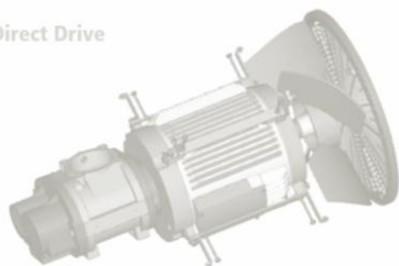
Albert Direct Drive